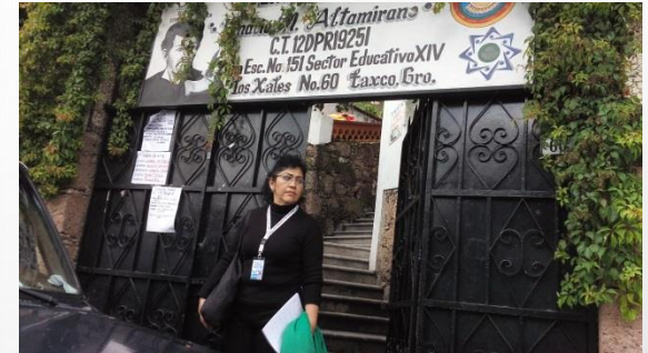
“IGNACIO MANUEL ALTAMIRANO”