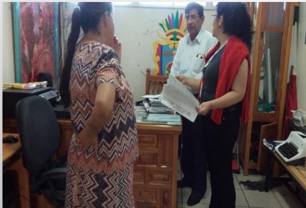
“EMPERADOR CUAUHEMOC” PROF. LUZ FELIX REZA LUGO